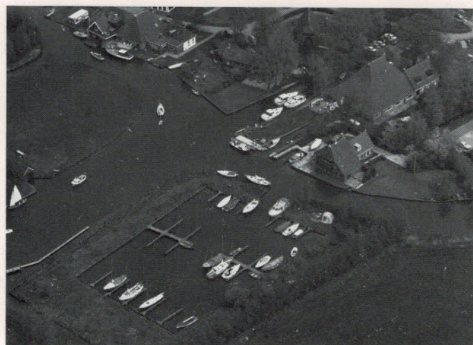
Luchtfoto watersportgebied Goingarip